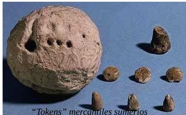
“Tokens” mercantiles sumerios

preservar la privacidad y evitar su manipulación, lo que demuestra que se alcanzó ya en aquéllos tiempos un alto nivel de complejidad técnica y sensibilidad hacia la privacidad y la libertad individual.