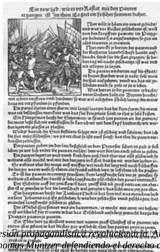
La primera impresión propagandística revolucionaria. Alemania siglo XVI. Declaración de Thomas Müntzer defendiendo el derecho de los campesinos a la insurrección. “Todas las cosas existen para ser mantenidas en común y la distribución deberá ser para cada cual respecto a su necesidad”.

Los gobiernos y las élites de poder tomaron ventaja en el uso de la imprenta y comenzaron tanto la impresión de su propia versión oficial de la Historia como la impresión de su propio y hegemónico bono-moneda. La Revolución Industrial supuso que una élite urbana controlara los medios de producción intensificados, la burguesía, desplazando el viejo modelo económico feudal basado en estructuras de poder sustentadas sobre la propiedad de la tierra y de sus habitantes. En aquél caso el principal depósito de valor existente eran el tesoro de la corona y los almacenes de mercancías. En el nuevo sistema financiero y comercial burgués, la riqueza privada extraída del saqueo y explotación de colonias y mano de obra operaria forzada a aceptar condiciones de explotación mediante la represión, comenzó a poder ser depositada en gran volumen en activos de mercado y crédito, una forma de dinero “virtual” dependiente completamente de las entidades bancarias.