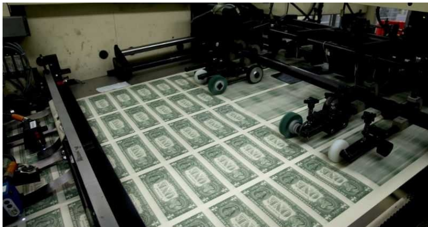
Impresión masiva de dinero fiducitario por la Reserva Federal de EEUU

En una primera etapa, los bancos, la herramienta financiera privada que dió lugar a este modelo, mantenían reservas de oro que les permitían respaldar la impresión de papel dinero a deuda, el dinero fiducitario o fiat . Más adelante, debido a la soberanía económica global de las élites de EEUU y la alta velocidad de desarrollo financiero, éstas impresiones de papel y apuntes en cuenta pasaron a no representar más que un precio fijado y pactado entre el gobierno de EEUU y los propios bancos nacionales. Comenzaría la impresión masiva de papel dinero sin respaldo real alguno más allá de la confianza en el propio sistema y las fluctuaciones de los mercados financieros. La Civilización Capitalista moderna se construiría sobre esta enorme burbuja de deuda y fraude insostenible.