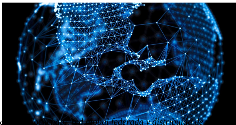
Cadena de Bloques (Blockchain): red global federada y distribuída de información y valor.

La Cadena de Bloques es una base de datos cifrada y distribuída en una red pública global que es mantenida por los participantes conectados. De esta forma no hay un sólo servidor o agente central que sea el encargado de validar y transmitir la información, sino que cada participante en la red ejerce esta función. Se trata de una red autónoma federada bajo un consenso matemático y cuyo contenido quedaría envuelto en capas de algoritmos de cifrado para evitar su manipulación o falsificación.