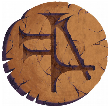
Ama-gi Token (pre-launch and concept idea)